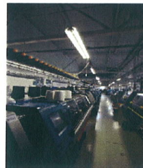
2-3 pav. Automatizuotos siuvimo ir mezgimo linijos įmonėje „Garlita“

Įmonės pripažinimas. UAB „Garlita“ yra garsi Garliavoje, gerai žinoma Kauno regione ir Lietuvoje įmonė dėl savo indėlio į bendruomenės stiprinimą, aplinkosaugos puoselėjimą, gaminių inovacijas, pramonės ir eksporto plėtojimą. Paminėtina, kad įmonė, įmonės kolektyvas arba įmonės vadovas gauna padėkas, apdovanojimus arba pažymėjimus už tai, kad finansiškai ir kitokiu savo indėliu prisideda, skatina ar remia įvairius renginius, organizacijas, bendruomenes. Galima paminėti šiuos: