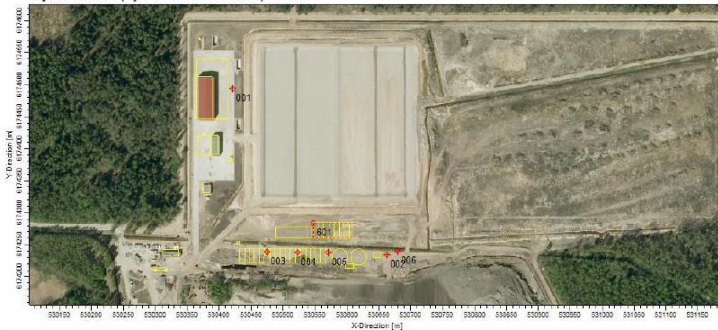
1 pav. Stacionarių aplinkos oro taršos šaltinių schema