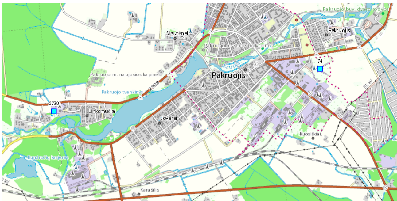
Pav. 4 Ištrauka iš www.lgt.lt

Artimiausias gyvenamas namas yra rytų kryptimi už 500 m. Artimiausios nekilnojamosios kultūros vertybės yra: Žibininkų akmuo su plokščiadugniu dubeniu (unikalus kodas: 13078) esantis apie 378 m atstumu ir Griežės kapinynas (unikalus kodas: 6367) esantis apie 1,25 km atstumu.