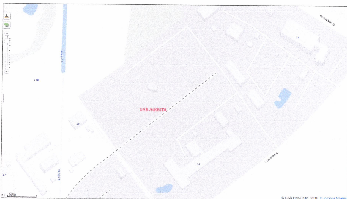
Pav. 2. Objekto vieta paviršinių vandens telkinių atžvilgiu