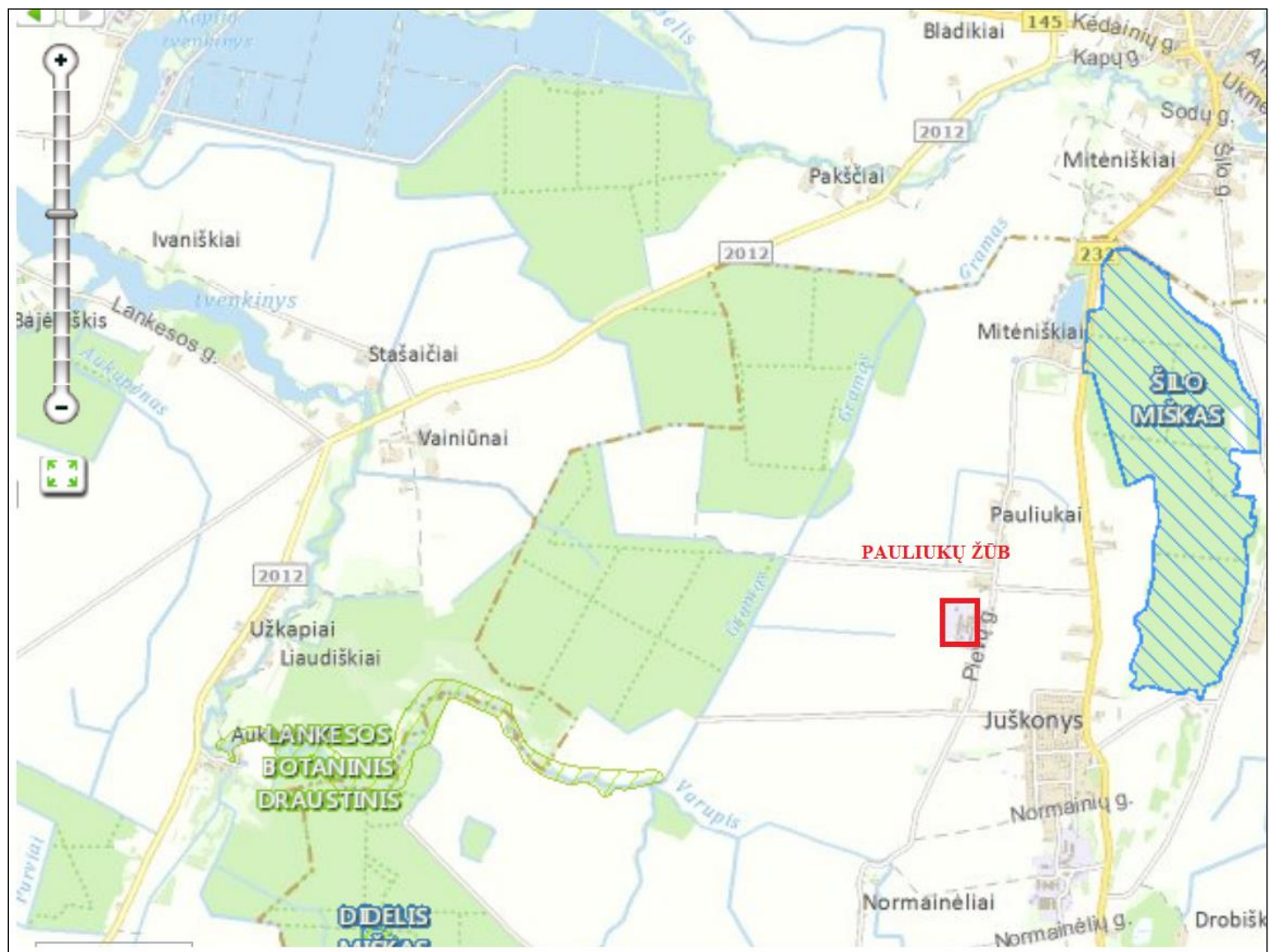
Pav. 3. Ūkinės veiklos vieta saugomų teritorijų atžvilgiu