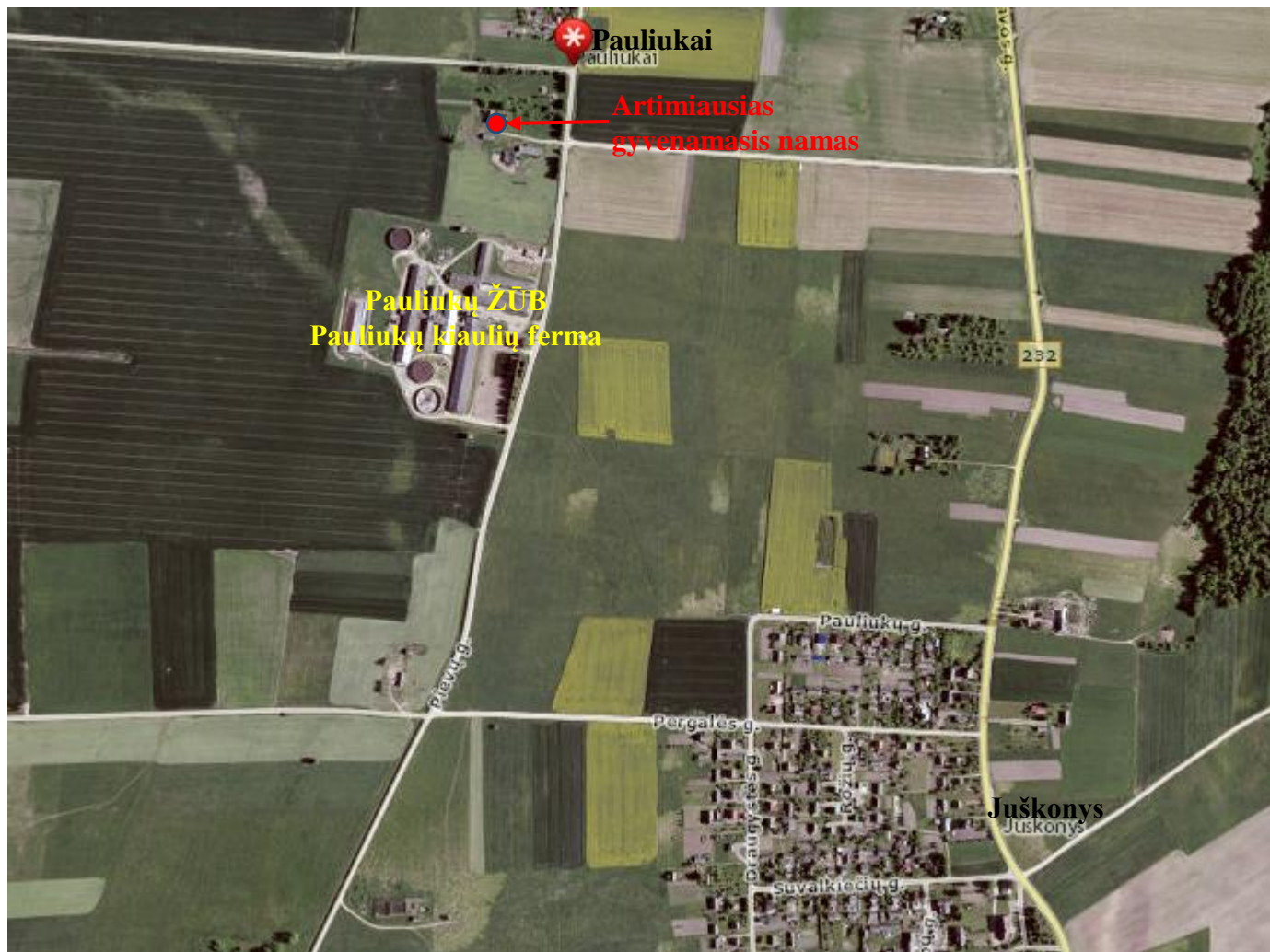
Pav. 1 . Ūkinės veiklos vieta artimiausių gyvenamųjų namų atžvilgiu (informacijos šaltinis: http://www.maps.lt )