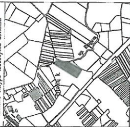
Žemės sklypo išdėstymo schema