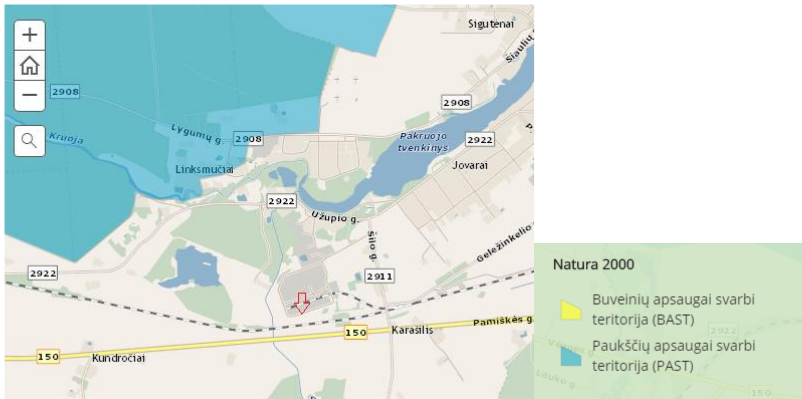
Pav. 2 ištrauka iš Saugomų teritorijų žemėlapiu

Artimiausia „Natura 2000“ teritorija yra Gedžiūnų miškas esanti už 1,030 km.